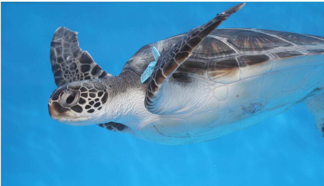
図1. ゆっくり遊泳するアオウミガメ

三陸沿岸域の定置網で生きたまま混獲されたアカウミガメとアオウミガメを収集し、形態計測(体重・前面投影面積)を行いました。また、飼育環境下で安静時の代謝速度を測定し、野生下での遊泳データと形態計測の結果を合わせて抵抗係数を推定して個体毎の最適遊泳速度を算出しました。その結果、予測された最適遊泳速度(秒速0.19-0.32 m)は測定された巡航遊泳速度(秒速0.27-