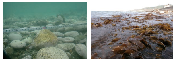
鉄を利用した藻場修復に向けた実証試験（北海道増毛町） （試験開始前の海底（左）と試験開始翌年の海域（右））

The relationship between forest, river, and sea is important for maintaining the coastal ecosystem, and the role of iron in the ecosystem has attracted increasing attention recently. We focused on the lack of dissolved iron in coastal areas and have developed a method for restoring seaweed beds by using a mixture of steelmaking slag and compost containing humic substances. The dynamics of chemical substances, mainly iron, in terrestrial and coastal areas has been investigated to understand the importance of iron in the coastal environment and ecosystem.