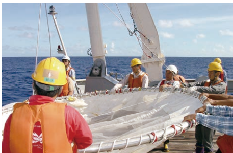
研究船白鳳丸による大型ORIネット作業

沿岸域の環境・生態系の保全に対しては、森・川・海のつながりの観点が重視されていますが、その中で鉄の動態についての関心が高くなっていると言えます。本研究では、海域の鉄不足が海藻群落や藻場生態系に与える影響に着目し、製鋼スラグと腐植物質（堆肥）を利用した藻場修復・造成技術の開発を行っています。また技術に関する研究から沿岸生態系における鉄の役割理解に向けた研究へと展開し、陸域や海域における鉄を中心とした物質動態評価等に取り組んでいます。