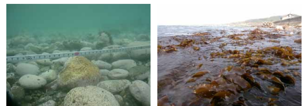
鉄を利用した藻場修復に向けた実証試験（北海道増毛町） （試験開始前の海底（左）と試験開始翌年の海域（右））

The relationship between forest, river, and sea is important for maintaining the coastal ecosystem, and the role of iron in the ecosystem has attracted increasing attention recently. We have developed a method for restoring seaweed beds and the coastal ecosystem by using a mixture of steelmaking slag and humic substances, focusing on the lack of dissolved iron in coastal areas. The dynamics of chemical substances, mainly iron, in terrestrial and coastal areas has been investigated to understand the importance of iron in the coastal environment and ecosystem.