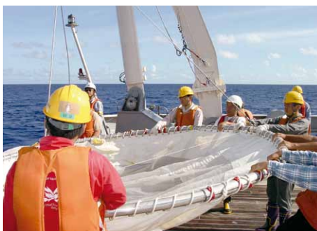
研究船白鳳丸による大型ORIネット作業

沿岸域の環境・生態系の保全に対しては、森・川・海のつながりの観点が重視されていますが、その中で鉄の動態についての関心が高くなっていると言えます。本研究では、海域の鉄不足が海藻群落や藻場生態系に与える影響に着目し、製鋼スラグと腐植物質を利用した藻場修復・造成技術の開発を行っています。また技術に関する研究から沿岸生態系における鉄の役割理解に向けた研究へと展開し、陸域や海域における鉄を中心とした物質動態評価等に取り組んでいます。