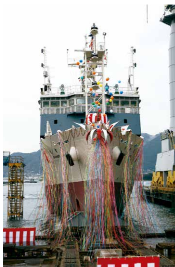
進水式における「新青丸」 (2013年2月) R/V Shinsei Maru at its launching (Feb 2013)