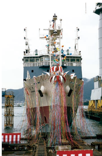
進水式における「新青丸」 (2013年2月) R/V Shinsei Maru at its launching (Feb 2013)