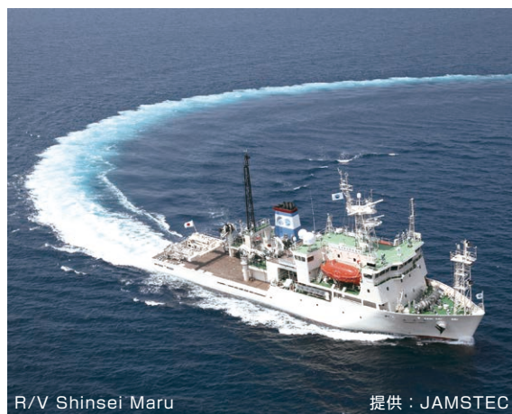
R/V Shinsei Maru