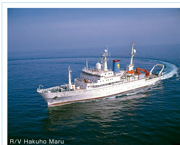
R/V Hakuho Maru

The second generation Hakuho Maru is a large vessel that has been in commission in 1989. Its overall length is 100 m, and its gross tonnage is 3991 t. It is used for long-term research navigation, for ocean navigation as well as inshore navigation. On the other hand, second generation Tansei Maru (51 m, 610 t) served for the national joint usage research from 1982 to 2013. Then, Shinsei Maru is a medium-sized research vessel that went into commission in 2013. Its overall length is 66 m and gross tonnage is 1635 t. It had been actively used for research studies in Japanese waters, especially for studies on current state and recovery processes of Tohoku marine ecosystems after the Tohoku-Pacific Ocean Earthquake that occurred on March 11, 2011.