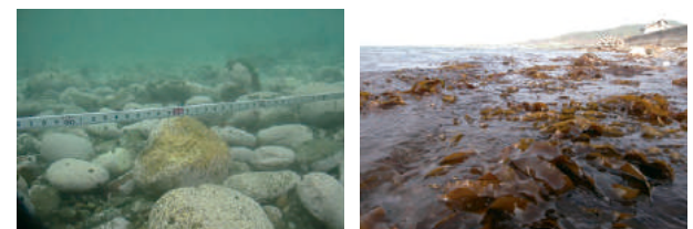
鉄を利用した藻場修復に向けた実証試験（北海道増毛町） （試験開始前の海底（左）と試験開始翌年の海域（右））