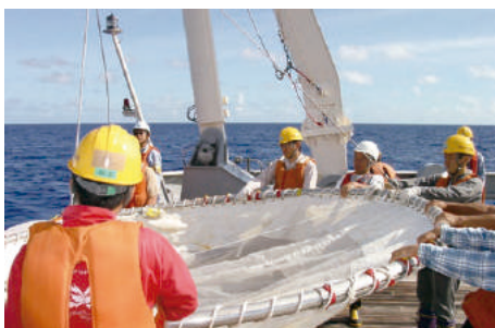
Large scaled ORI net operation on board R/V HakuhoMaru to sample fish larvae