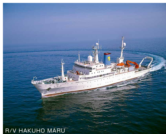
R/V HAKUHO MARU