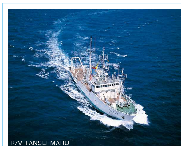
R/V TANSEI MARU

The research vessel Tansei Maru is 51m long and displaces 610 gross tons. She entered service in 1982 and is used for a relatively short cruises near Japan. The research vessel Hakuho Maru is 100m long and displaces 3991 gross tons. She entered service in 1989 and is used for cruises globally.