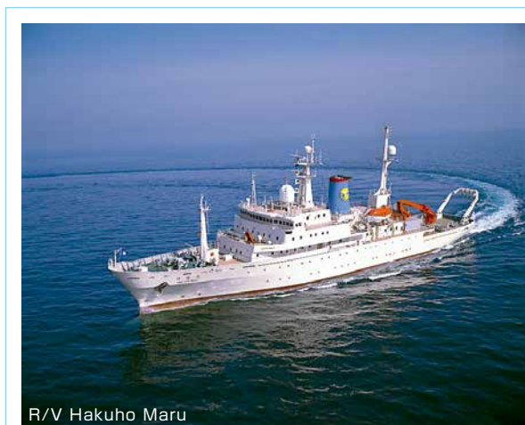
R/V Hakuho Maru

The second generation Hakuho Maru is a large vessel that has been in commission in 1989. Its overall length is 100 m, and its gross tonnage is 3991 t. It is used for long-term research navigation, for ocean navigation as well as inshore navigation. On the other hand, second generation Tansei Maru (51 m, 610 t) served for the national joint usage research from 1982 to 2013. Then, Shinsei Maru is a medium-sized research vessel that went into commission in 2013. Its overall length is 66 m and gross tonnage is 1635 t. It had been actively used for research studies in Japanese waters, especially for studies on current state and recovery processes of Tohoku marine ecosystems after the Tohoku-Pacific Ocean Earthquake that occurred on March 11, 2011.