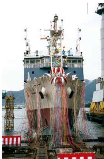
進水式における「新青丸」 (2013年2月) R/V Shinsei Maru at its launching (Feb 2013)