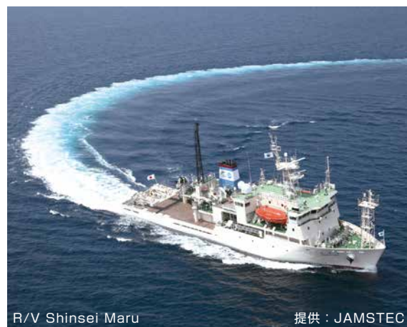
R/V Shinsei Maru