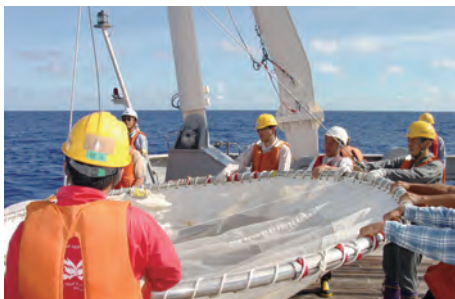
Large scaled ORI net operation on board R/V HakuhoMaru to sample fish larvae