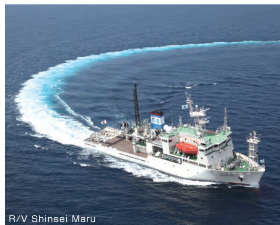
R/V Shinsei Maru