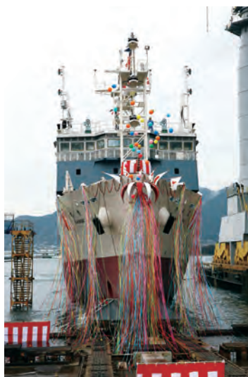
進水式における新青丸 (2013年2月) R/V Shinsei Maru at its launching (Feb 2013)

学術研究船 白鳳丸 起工：1988年5月9日 進水：1988年10月28日 竣工：1989年5月1日