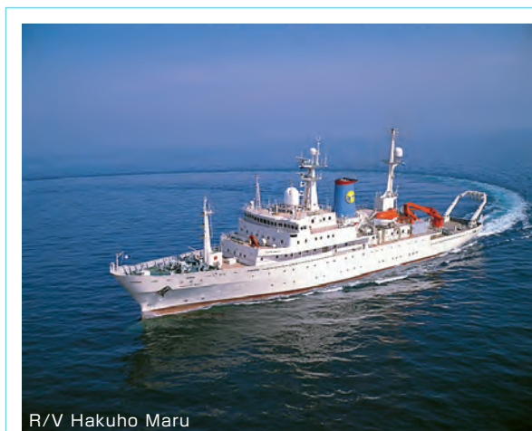
R/V Hakuho Maru

The second generation Hakuho Maru is a large vessel that has been in commission in 1989. Its overall length is 100 m, and its gross tonnage is 3991 t. It is used for long-term research navigation, for ocean navigation as well as inshore navigation. On the other hand, second generation Tansei Maru (51 m, 610 t) served for the national joint usage research from 1982 to 2013. Then, Shinsei Maru is a medium-sized research vessel that went into commission in 2013. Its overall length is 66 m and gross tonnage is 1629 t. It had been actively used for research studies in Japanese waters, especially for studies on current state and recovery processes of Tohoku marine ecosystems after the Tohoku-Pacific Ocean Earthquake that occurred on March 11, 2011.