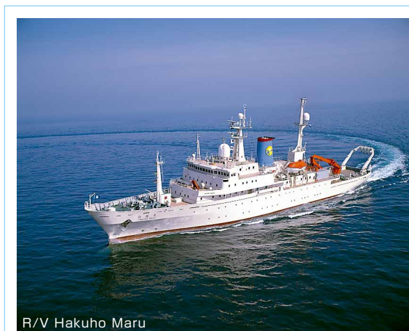
R/V Hakuho Maru

The second generation Hakuho Maru is a large vessel that has been in commission in 1989. Its overall length is 100 m, and its gross tonnage is 3991 t. It is used for long-term research navigation, for ocean navigation as well as inshore navigation. On the other hand, second generation Tansei Maru (51 m, 610 t) served for the national joint usage research from 1982 to 2013. Then, Shinsei Maru is a medium-sized research vessel that went into commission in 2013. Its overall length is 66 m and gross tonnage is 1629 t. It had been actively used for research studies in Japanese waters, especially for studies on current state and recovery processes of Tohoku marine ecosystems after the Tohoku-Pacific Ocean Earthquake that occurred on March 11, 2011.