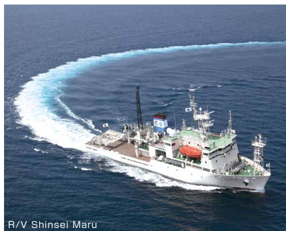
R/V Shinsei Maru