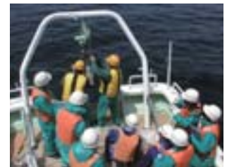
新領域創成科学研究科 環境学系 自然環境学専攻 Department of Natural Environmental Studies, Division of Environmental Studies, Graduate School of Frontier Sciences

The educational program of Marine Environmental Studies is unique in that graduate students conduct their academic life on the campus of the Ocean Research Institute, offering exceptional opportunities to participate in research cruises and other field work. Students can observe natural phenomena directly, learn modern research techniques, and pursue their own investigations together with many young foreign scientists. The Marine Environmental Studies program is designed to provide graduate students with both field and classroom lecture experience, so that they can develop abilities to investigate environmental processes in the ocean and to develop solutions for current and future environmental challenges.