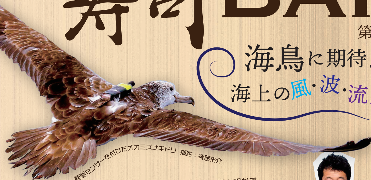
観測センサーを付けたオオミスナギドリ